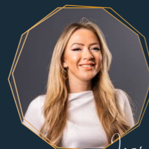
Jeany Frontoffice medewerker