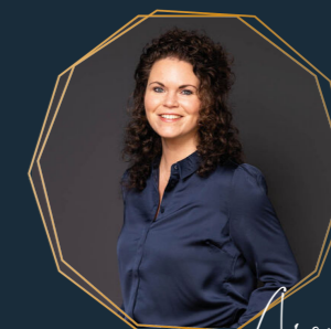
Anouk Verhuurmakelaar / Nieuwbouw