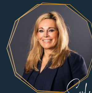
Sylvre Frontoffice medewerkster