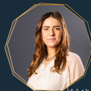
Annemijn Binnendienst hypotheek