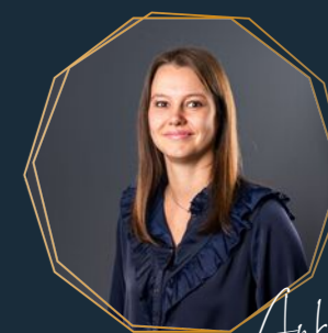
Anke Dossiermanager wonen